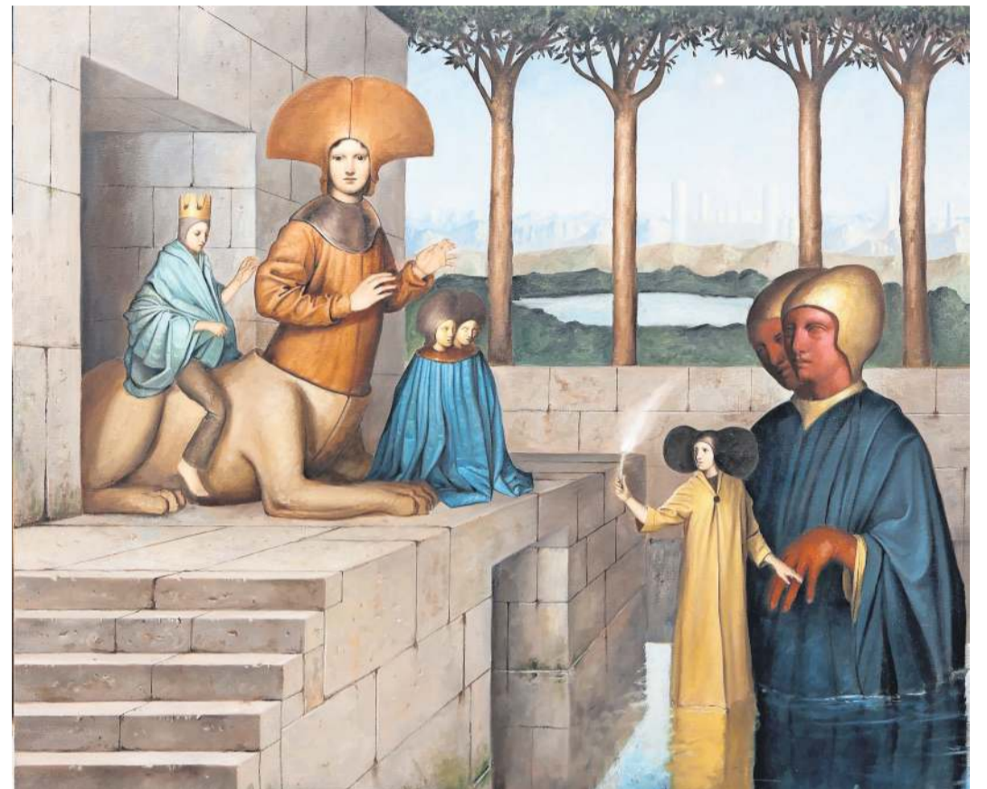
Von Alessandro Sicioldr ist das Ölgemälde „Il Drama“ bei der diesjährigen Wettbewerbs-Ausstellung in der Kieler Stadtgalerie dabei.

Neben dem Hauptpreis vergibt die Stiftung zwei Anerkennungspreise. Vom Erstplatzierten werden Arbeiten im Wert von bis zu 12.000 Euro für die Sammlung der „Volker Walter Feierabend-Stiftung“ angekauft. Vom Zweitplatzierten werden Werke im Wert von bis zu 6000 Euro für die Sammlung angekauft, die Künstlerin oder der Künstler auf Platz drei kann im-