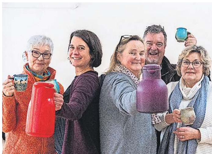
Mit Kaffee, Tee und Zeit für Gespräche wartet das Team des Friedhofsschnacks auf die, die reden möchten.

Schon einmal merken können sich Jung und Alt den 10. bis 16. August für das Ferienprogramm „Sommer zu Haus“. Alle sind eingeladen, auch spontan und an einzelnen Tagen vorbeizukommen und bei den verschiedenen Aktionen, die das Vorbereitungsteam gerade plant, mitzumachen. Das Programm wird in und um die Maria-Magdalenen-Kirche herum stattfinden.