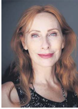
Andrea Sawatzki liest am heutigen Sonnabend im Konzerthaus am Schloss in Kiel aus ihrem neuen Roman.