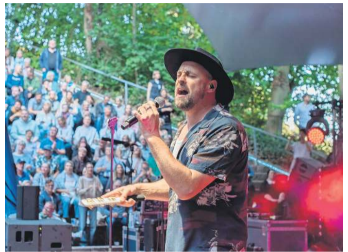
Beim diesjährigen „Konzert gegen die Kälte“ wird erneut Max Mutzke als Hauptact auf der Bühne an der Krusenköppl stehen.