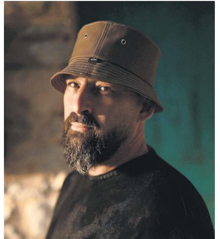
Gentleman wird in diesem Jahr zur Kieler Woche gemeinsam mit dem Philharmonischen Orchester Kiel auf der Rathaus-Bühne stehen.

Ermöglicht wird das „Classic Open Air“ zur Kieler Woche auch in diesem Jahr vom Kieler-Woche-Förderverein, der seit 1999 die Kieler Woche mit hochkarätigen und niveaureichen Veranstaltungen und Events unterstützt. Neben dem „Classic Open Air“ unterstützt der Verein zum Beispiel auch die „Junge Bühne“ und das „Kieler-Woche-Hoftheater“ im Hiroshimapark. Infos zum Verein sind online unter www.kieler-woche.de/foerderverein zu finden.