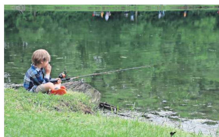
Auch Angeln ist als Angebot für den Ferienpass wieder dabei.