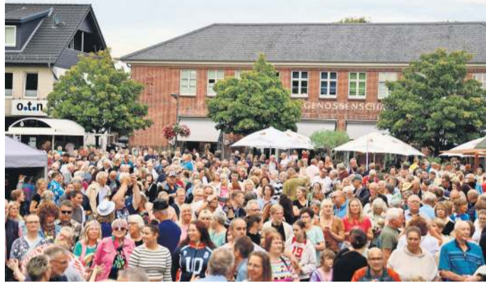
Im vergangenen Jahr kamen bereits Tausende von Besucherinnen und Besuchern zum Musiksommer in Nortorf.

NORTORF. Als eher gemütliches Stadtfest hat der Nortorfer Musiksommer vor ein paar Jahren angefangen. In diesem Jahr ist der inzwischen fünfte Nortorfer Musiksommer schon ein kleines Festival, das Besucherinnen und Besucher längst nicht mehr nur aus Nortorf, sondern aus der ganzen Region vor die Bühne auf den Marktplatz mitten im Ort zieht. Von Mitte Juni bis Ende August verwandelt sich der Nortorfer Marktplatz alle zwei Wochen an insgesamt sechs sommerlichen Donnerstagabenden erneut in eine große Open-Air-Bühne mit Live-Musik, Gastronomie und besonderer Atmosphäre – und das alles bei freiem Eintritt. Zum fünften Geburtstag setzt der Nortorfer Musiksommer auf ein musikalisches Best-of der erfolgreichsten und beliebtesten Acts der vergangenen Jahre. Den Anfang macht am Donnerstag, 18. Juni, die Queen-Tribute-Show „Queen II – Magic Tribute“. Am 2. Juli sind „Rudolf Rock & die Schocker mit Hugo Egon Balder zu erle-