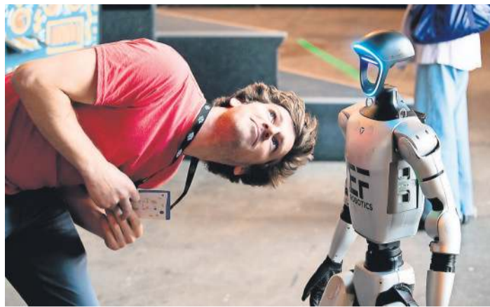
Um Ideen für die Gestaltung der Zukunft geht es beim Waterkant-Festival.