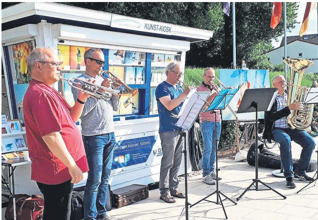
Auch das Ensemble „Mare Brass“ ist am Sonnabend, 6. Juni, im Geburtstagsprogramm für den Kunst-Kiosk in Heikendorf dabei.

Nach der Show ist vor der Show: Die Pferde-Show „ Caval-luna “ war gerade erst zu Gast in der Kieler Merkur Ostseehalle, aber schon jetzt steht fest: Am 1. und 2. Mai 2027 kehrt sie mit ihrem neuen Programm „Die Farben des Lebens“ zurück nach Kiel . Und schon jetzt kann man dafür auf www.merkur-ostsee-halle.de Tickets kaufen.