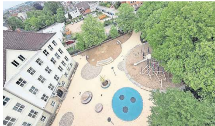
Die neue Gestaltung des Schulhofs soll ihn als Spiel- und Aufenthaltsort attraktiver machen.

KIEL. Der von der Kieler Ratsversammlung im Jahr 2022 beschlossene „Aktionsplan Schulhöfe“