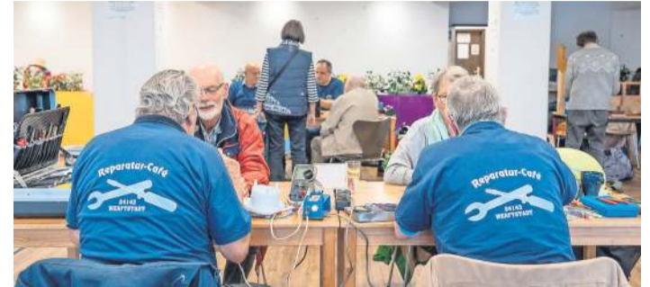
Kaputte Dinge können mit etwas Glück beim Reparaturcafé Gaarden wieder zum Leben erweckt werden.