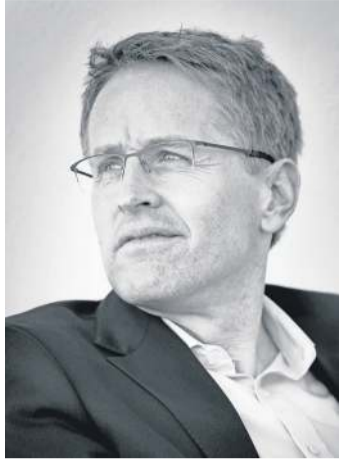
Um Daniel Günther dreht sich der Abend „Soundtrack meines Lebens“ am Freitag, 5. Juni, im Kieler Kulturforum.