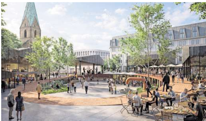
Im Rahmen der „Kieler Perspektiven“ wurde im April die Zukunft des Alten Marktes diskutiert. Die Visualisierungen von C.F. Möller Architects (cfmoller.com) sollen als Inspiration und Impuls für die Diskussion dienen. Sie zeigt kein konkretes Bauprojekt.

Wer eigene Ideen zur Zukunft des Alten Marktes in den Online-Dialog einbringen möchte, kann das auf der Webseite https://alter-markt-perspektiven.dialog-kiel.de/ noch bis zum 31. Mai tun. Für den September ist eine Gestaltungswerkstatt geplant: In einem Workshop mit fünf Architekturbüros sollen unter Beteiligung der Öffentlichkeit die eingereichten Ideen diskutiert werden. Am Ende des Workshops soll ein Zielbild stehen und vorgestellt werden.