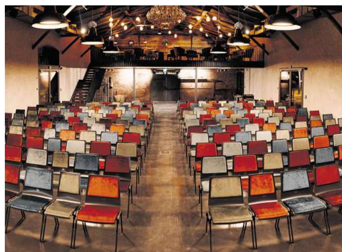
Mit Industriecharme und Club-Atmosphäre bietet der Kulturschuppen einen Platz für Kultur in Bad Segeberg.

Daneben bieten die Räume des Kulturschuppen auf rund 400 Quadratmetern Fläche auch viel Platz für Messen, Produktpräsentationen, Tagungen und Firmen-events – zentral am Bahnhof gelegen und logistisch gut erreichbar. Auch für private Feierlichkeiten kann der Kulturschuppen gebucht werden. Alle Infos und Kontaktmöglichkeiten sowie die Möglichkeit zum Ticketkauf sind auf www.kulturschuppen-segeberg.de zu finden.