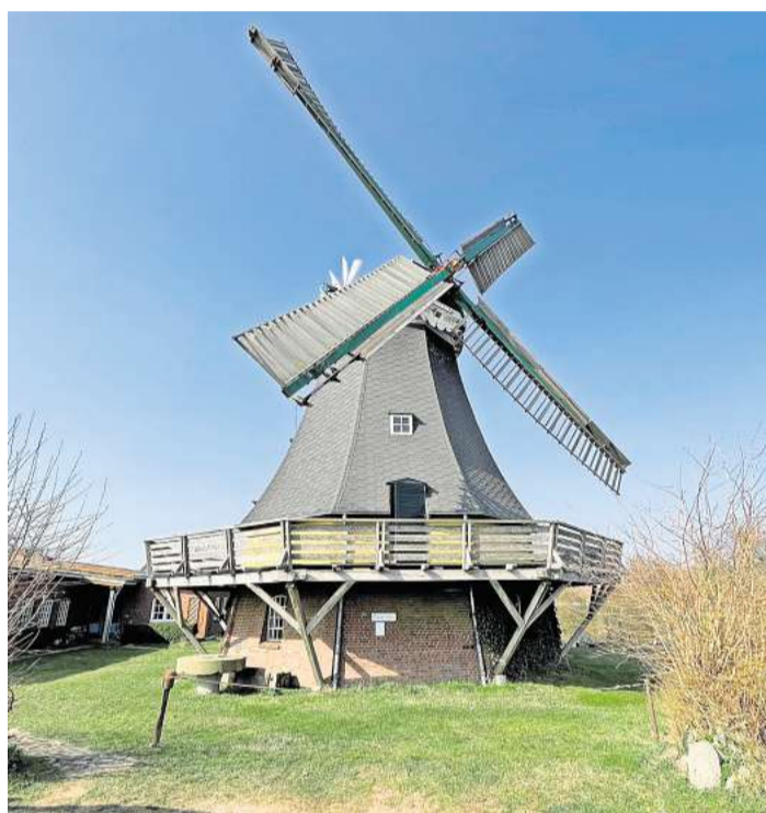
Die alte Holländermühle „Sventana“ in Ascheberg bei Plön ist ebenfalls zum Mühlentag am Pfingstmontag geöffnet.