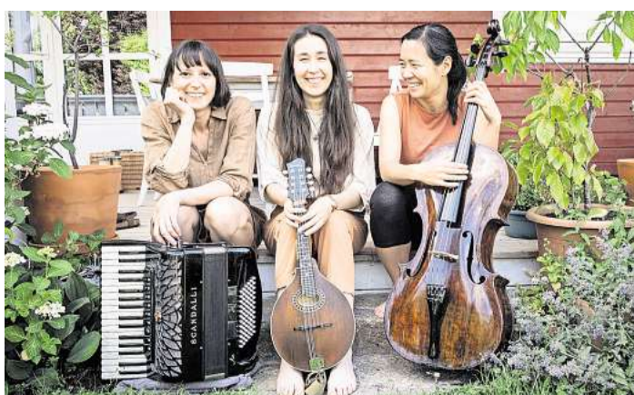
Drei Frauen, drei Stimmen, viele Instrumente: „Heide lauscht“ sind am Freitag, 29. Mai, in der Kieler Bethlehem-Kirche zu erleben.

„Ich habe gemerkt, dass ich Gesprächen nicht mehr richtig folgen konnte. Das war sehr unangenehm. Dank GEERS kann ich Gespräche wieder voll und ganz genießen. Ich empfehle jedem, den Test zu machen und den Unterschied selbst zu erleben!“