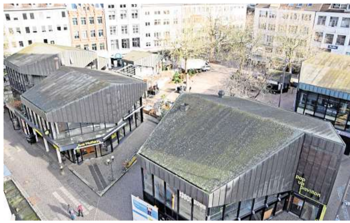
Vielen Menschen ist die aktuelle Gestaltung des Alten Marktes in Kiel eher ein Dorn im Auge.

Wichtig für die Planung eines veränderten Alten Marktes wird in jedem Fall der gesetzliche Rahmen des Denkmalschutzes sein. Größere Eingriffe oder sogar der Abriss von Pavillons sind deshalb weniger wahrscheinlich, sie müssten auf jeden Fall zuerst im Einklang mit dem Denkmalschutz genehmigt werden. Nach Angaben der Stadt muss zwischen dem öffentlichen Interesse am Erhalt des Denkmals und den Anforderungen an eine zeitgemäße Nutzung abgewogen wer-