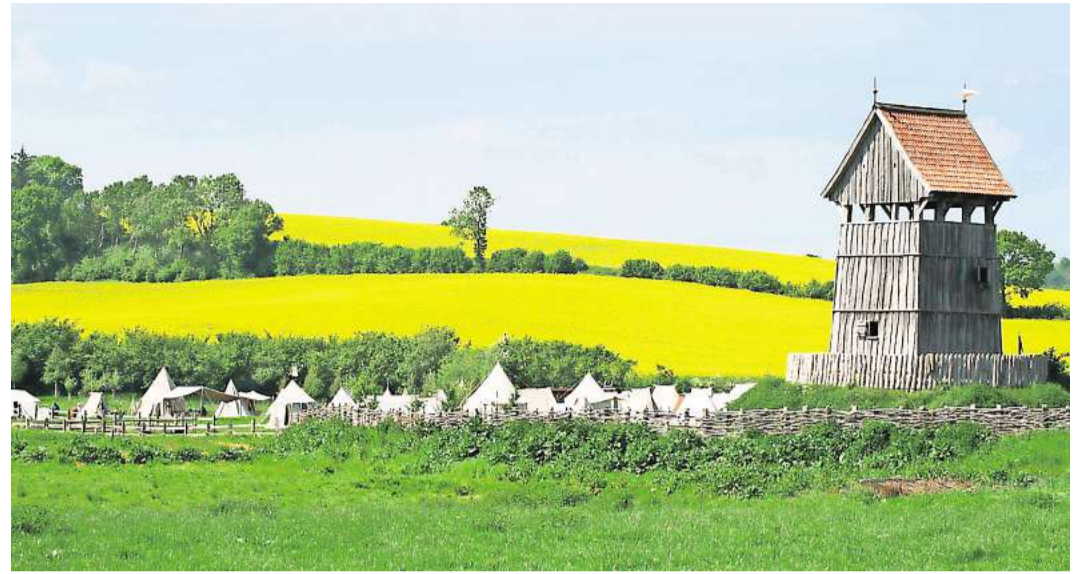
Auf der Turmhügelburg im Lütjenburg wird es an diesem Wochenende wieder mittelalterlich.

Am 14. Dezember 2026 ist das Weihnachtsmusical „Last