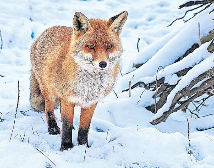
Der Wildpark Eekholt bietet an den Sonntagen im Januar ab jeweils 15 Uhr geführte Winterwanderungen durch den Park mit anschließendem Grünkohl-essen an.

Eine Gitarre hat einen einzigartigen Klang, hat Wurzeln überall auf der Welt und ist bis in die heutige Zeit ein beliebtes Instrument für Musikanfänger und Fortgeschrittene. Am Sonnabend, 24. Januar , startet um 19.30 Uhr die 4. lange Gitarrennacht im „Savoy“ in Bordesholm , Schulstraße 7. Eintritt: Mitglieder 22 Euro, Nichtmitglieder 24 Euro.