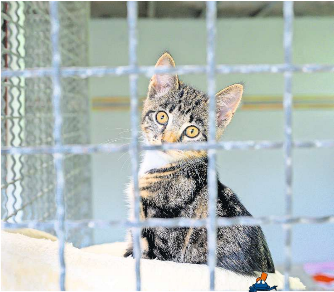
Immer wieder landen auch Katzenkinder im Tierheim Uhlenkrog.