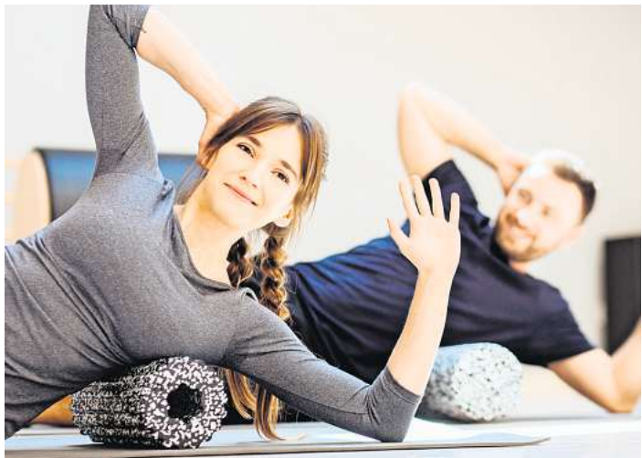
Ob in der Gruppe oder beim individuellen Training: Das Team vom Athletic Fitnessland unterstützt Ihre guten Vorsätze.

Athletic Fitnessland Klausdorfer Weg 171, Kiel Tel. 0431/729606 info@athleticfitnessland.de www.athleticfitnessland.de