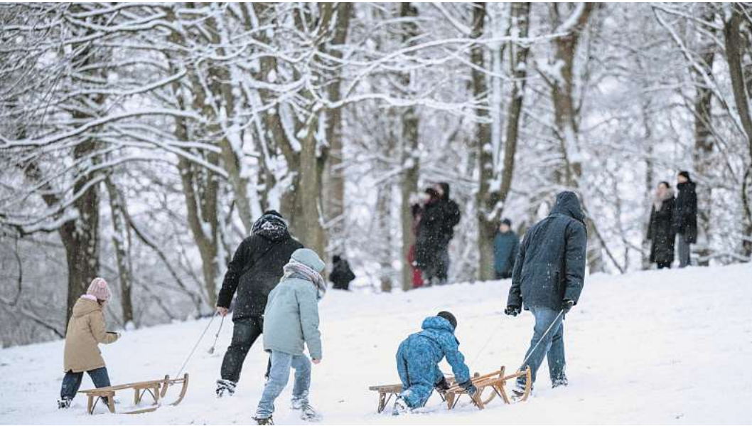
Wintereinbruch in Kiel: Unter anderem der Werftpark wurde in dieser Woche von Familien zum Schlittenfahren genutzt.

KIEL. Winterwunderland Kiel? Ja, ein Wunderland war Kiel in der vergangenen Woche in vielerlei Hinsicht. Doch während die einen sich über die weiße Pracht und den damit verbundenen Zauber erfreuten, wunderten sich andere darüber, dass der gesamte Verkehr beispielsweise am späten Sonnabendnachmittag in der Landeshauptstadt zum Erliegen kam. Starker Schneefall hatte in nur wenigen Stunden dafür gesorgt, dass die Straßen nicht mehr befahrbar waren und sogar der Busverkehr bis einschließlich Sonntagvormittag eingestellt wurde. In den Sozialen Medien beschwerten sich zahlreiche User und Userinnen über die Zustände, die einer Landeshauptstadt nicht würdig, aber eben typisch für Kiel seien. Denn so ungewöhnlich sei Schneefall im Januar nun wirklich nicht. Viele Kielerinnen und Kieler monierten mangelnde Räum- und Streudienste. Dabei waren am Sonnabend rund 120 Beschäftigte des ABK ab 15 Uhr mit 75 Räum- und Streufahrzeugen im Einsatz gewesen, um die Hauptverkehrsstraßen von Schnee und Eis zu befreien. Doch wegen der sehr kalten Temperaturen fror der immer weiter fallende feuchte Schnee sofort, sodass sich immer wieder Eisdecken bildeten und die Straßen zu gefährlichen Rutschbahnen wurden. Christian Schmitt, Werkleiter des ABK, sagte den Kieler Nachrichten, dass die Streufahrzeuge am vergangenen Sonnabend zweimal 1600 Streukilometer durch Kiel