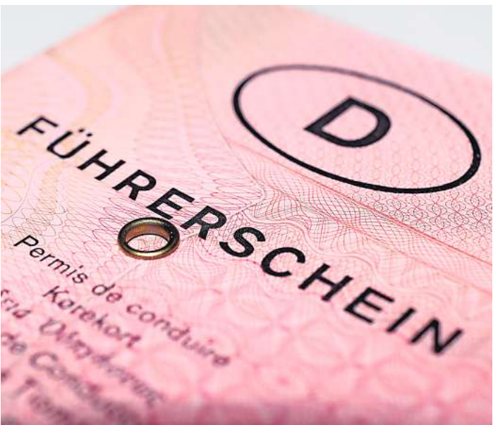
Wer jetzt noch so einen alten Führerschein hat, wird ihn wahrscheinlich noch in diesem Monat umtauschen müssen.

rechnet dadurch für Diesel und Benzin mit einem Preisanstieg von etwa 1,5 bis 3 Cent pro Liter. Teurer könnten auch Neuwagen werden, denn sie müssen laut dem Automobil-Club Europa ab dem 7. Juli dieses Jahres neue Sicherheitsstandards erfüllen. Neu zugelassene Pkw und leichte Nutzfahrzeuge müssen ab dann unter anderem mit einem Notbremsassistenten mit Fußgänger- und Radfahrer-Erkennung und einem Ablenkungswarnsystem ausgestattet sein. Außerdem wird ein erweiterter Kopfschutz für Fußgängerinnen und Fußgänger Pflicht – etwa durch eine entsprechend optimierte Fahrzeugfront. Mit Gebühren verbunden ist auch der vorgeschriebene Umtausch alter Führerscheine in die neuen EU-Kartenführerscheine. Wer in den Jahren 1999 bis 2001 einen Führerschein erworben hat und ihn noch nicht gegen den EU-Kartenführerschein eingetauscht hat, muss sich langsam beeilen: Die Frist dafür läuft am 19. Januar ab. Entspannt zurücklehnen können sich dagegen alle, die jetzt noch einen alten Führerschein haben, aber vor 1953 geboren sind: Sie müssten ihren Führerschein theoretisch erst bis zum 19. Januar 2033 umtauschen. Einen verbesserten Schutz vor unnötigen Kosten könnten dagegen die beiden folgenden Neuerungen bedeuten, die allerdings erst in der zweiten Jahreshälfte in Kraft treten sollen: Auf neu in Kraft tretende Verbraucherrechte weist die Europäische Verbraucherzentrale hin