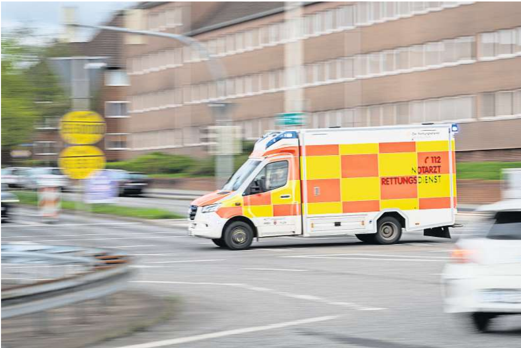
Nach einem Herzstillstand retten eine schnelle Reanimation und Versorgung durch Ersthelfende und Fachpersonal Leben. Doch manchmal haben Patientinnen oder Patienten sowie Angehörige auch danach noch Unterstützungsbedarf.

Hier soll das Projekt „CAROL“ ansetzen: Die Nachsorge beginnt bereits auf der Intensivstation und wird über ein Jahr hinweg fortgeführt. Im Zentrum steht dabei die sogenannte „PRA-Nurse“ – eine spezialisierte Fachkraft, die als konstante Ansprechperson durch alle Phasen der Behandlung begleitet. Die