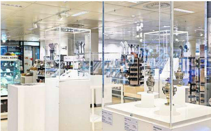
Fast unauffällig fügen sich antike Riechdosen in das Parfüm- und Schmucksortiment bei der Galeria Kiel ein.

standen sie das Feuer, das 1948 nach Bombentreffern große Teile des ursprünglichen Museumsbaus zerstörte. Heute wird die Thaulow-Sammlung im Schloss Gottorf in Schleswig bewahrt. Von dort konnten sich „PIKPorree“ die Gegenstände für ihre Ausstellung ausleihen. Mit der Ausstellung machen sie nicht nur einen Teil der Geschichte dieses Ortes sichtbar, sondern stellen auch Gegenwart und Vergangenheit direkt gegenüber: Hätte es dieses Kaufhaus vor 150 oder 400 Jahren schon gegeben, könnten diese Artikel damals als ganz normale Alltagsgegenstände im Sortiment angeboten worden sein. Auf diese Weise fragt „PIKPorree“ auch danach, wie Alltags-