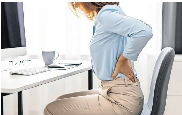
Gesundheitliche Probleme wie Rückenschmerzen treten häufig als Folge von zu vielem Sitzen auf.

vom Sitzen zur Bewegung nicht nur gesundheitlich, sondern auch finanziell zum lohnenden Invest. Weitere Informationen sowie Details zu Gesundheits-sportangeboten in den Bereichen Fitness, Wellness, Body-care oder Rehasport bei orthopädischen Beschwerden gibt es unter Tel. 0431/729606. Athletic Fitnessland GmbH Klausdorfer Weg 171, Kiel Tel. 0431/729606 info@athleticfitnessland.de www.athleticfitnessland.de