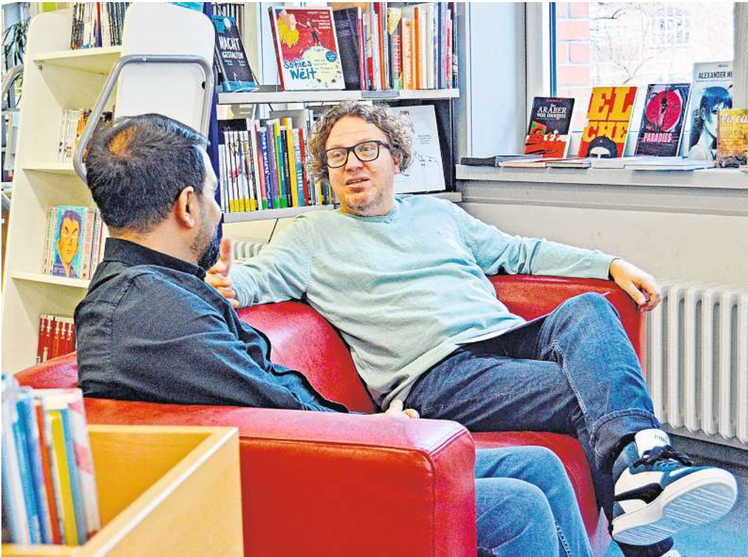
Das neue Beratungsangebot setzt auf die entspannte und ungezwungene Umgebung der Kieler Stadtbücherei.

Bereits jetzt steht in der Zentralbücherei Kiel in der Andreas-Gayk-Straße 31 jeden Dienstag von 15 bis 17 Uhr ein Mitarbeiter des Amtes für Wohnen und Grundsicherung als Ansprechpartner zur Verfügung. Er bietet Erstberatung, Orientierung und bei Bedarf auch eine Weitervermittlung an andere Hilfesysteme an – das Ganze möglichst direkt und ohne Hürden. Gleichzeitig wird das Bibliotheksteam im Um-