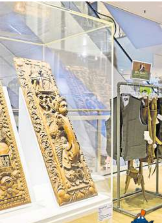
Passend zur aktuellen Herrenmode sind rund 300 Jahre alte Mangelbretter zu sehen, die damals zum Glätten der Wäsche dienten.

dem 19. Jahrhundert in der Parfümerie- und Schmuckabteilung. Das ganz Besondere: All diese Ausstellungsstücke waren schon einmal hier. Und zwar vor langer Zeit, als das heutige Karstadt-Gebäude noch gar nicht gebaut war und an dieser Stelle noch das Thaulow-Museum stand. Die letzten Teile des ursprünglich 1878 eröffneten Thaulow-Museums wurden 1970 für den Neubau des Kaufhauses „Herti“ abgerissen. 1994 übernahm die Kaufhauskette Karstadt das Warenhaus an der Ecke Ziegelteich und Sophienblatt in Kiel.