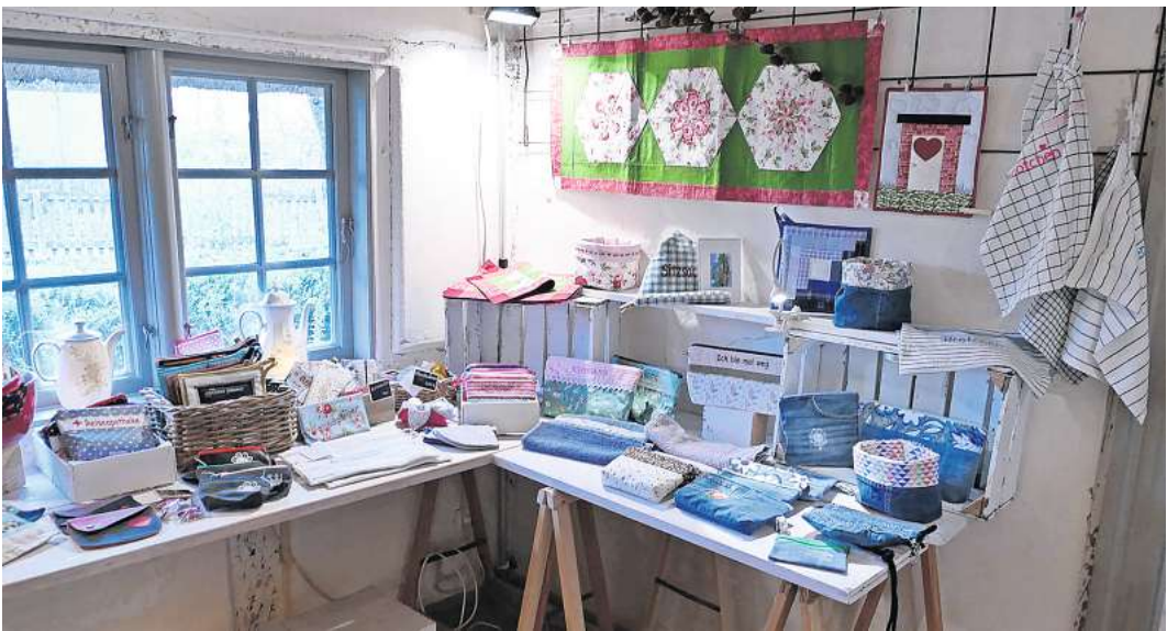
In der Dunkerschen Kate in Bosau können sich Besucherinnen und Besucher noch bis zum morgigen Sonntag, 23. November, auf kunsthandwerkliche Dinge freuen.