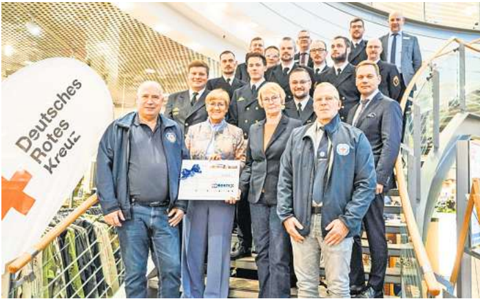
Gemeinsam konnten sich die beteiligten Soldaten der IV. Logistikscheule der Bundeswehr, das Team des Nortex-Modehauses und die Vertretenden des DRK über die erfolgreiche Spendenaktion freuen.