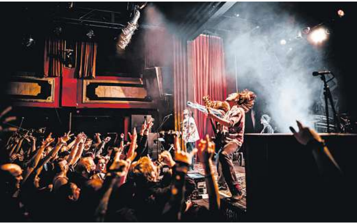
Zum Abschluss eines wilden Jahres wollen es Grell am zweiten Weihnachtstag in der Kieler Pumpe noch einmal so richtig krachen lassen.

Das Grellfest in der Pumpe feiern die fünf mit ihren Fans und allen, die neugierig genug sind, um vielleicht zum ersten Mal zu erleben, wie sehr die Grell-Rocker ihr Publikum vor allem im Livekonzert-Modus mitreißen. Tickets für das „Grellfest“ gibt es für 33,70 Euro auf http://grellmusik.de im Shop.