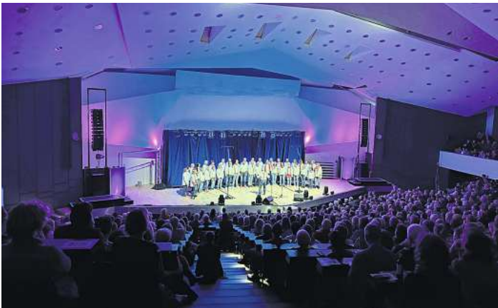
Am 29. November steigt die große „A-cappella-Party Kiel“ im Audimax der CAU Kiel.

„Die Rolle der Marine in Kiel im Zweiten Weltkrieg und heute“