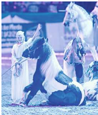
Beim Pferdewinter in den Holstenhallen in Neumünster gibt es Infos, Shows und mehr für die gesamte Familie.