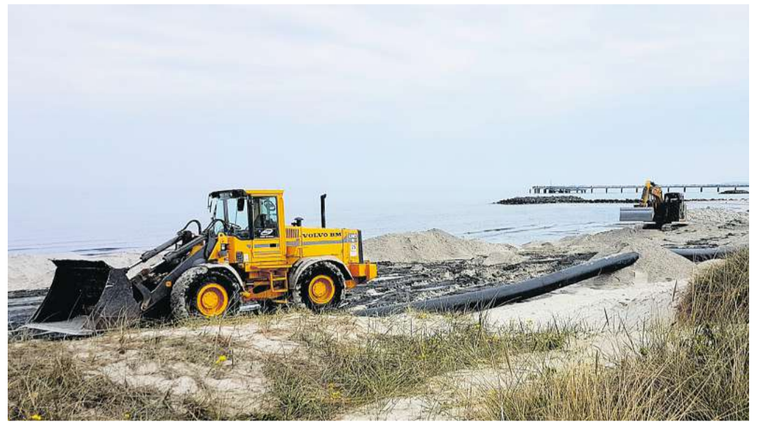
Fast jedes Jahr müssen die Strände des Ostseebades Schönberg an einigen Stellen mit frischem Sand aufgefüllt werden. Durch die Sturmflut im Winter sind die Sandverluste dieses Mal aber ganz besonders hoch.

legen großen Wert darauf, die Beeinträchtigungen für Einwohner und Besuchende auf ein Minimum zu reduzieren.“ Während der Sandaufspülung kann es sein, dass einzelne Strandbereiche nur eingeschränkt oder gar nicht nutzbar sind. Die Gemeinde Schönberg bittet um Verständnis und Geduld. „Wir versprechen, alles in unserer Macht Stehende zu tun, um die Schönheit unseres Strandes und die Sicherheit unserer Küstengemeinde zu bewahren“, so Heuer und Schechten. Laut der Gemeinde Schönberg dürften die Kosten der diesjährigen Sandaufspülung bei weit über 800.000 Euro liegen. Ohne die Unterstützung durch das Land wäre die Wiederherstellung der Strände nach Einschätzung von Bürgermeister Kokocinski kaum möglich.