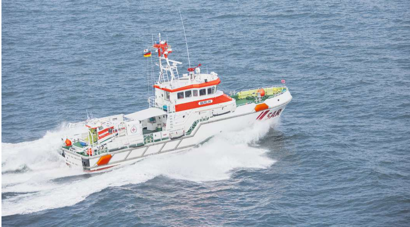
Mit dem Seenotrettungskreuzer „Berlin“ der DGzRS sind die Seenotretter aus Laboe im Einsatz für einen schwer verletzten Segler gewesen.