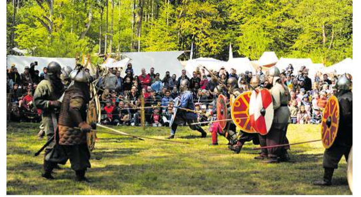
Am Himmelfahrtswochenende gibt es im Wildpark Eekholt täglich Schaukämpfe.

Küchenstudio Regina ReMa Haus und Küche GmbH Rosenberg 10 24220 Flintbek Tel.: 04347-7380065