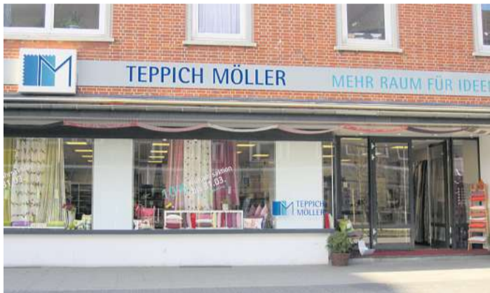
Beim Traditionsunternehmen „Teppich Möller“ in Kiel läuft aktuell der Räumungsverkauf wegen Geschäftsaufgabe.

Das 1931 gegründete Kieler Traditionsunternehmen „Teppich Möller“ in der Holtenauer Straße 9 hat mit einem großen Räumungsverkauf seine endgültige Schließung eingeleitet. Für Inhaber Torsten Loesch auch mit Blick auf seine langjährig treuen Kunden und Geschäftspartner keine leichte Entscheidung: „Sicher spielt für die Entscheidung auch eine Rolle, dass die Zeiten im stationären Einzelhandel schwierig geworden sind. Aufgrund meines Alters habe ich mich zu der Geschäftsaufgabe entschlossen und leider gibt es keinen