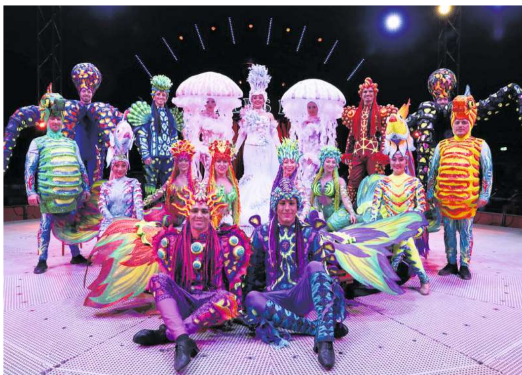
Bunt und fröhlich wird es im Zirkus Charles Knie auf dem Kieler Wilhelmsplatz.

Zirkus Charles Knie kommt mit europaweit einzigartiger Show nach Kiel