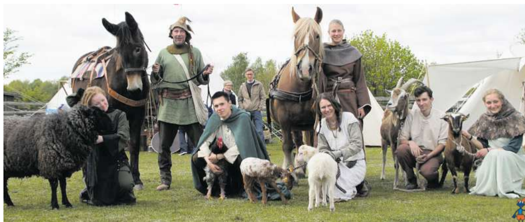
Eintauchen ins bäuerliche Leben vor Hunderten von Jahren: Das und noch mehr können Jung und Alt am Himmelfahrts-Wochenende in der Arche Warder erleben.