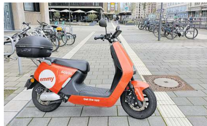
So nicht: Das Moped steht quer zur Laufrichtung auf dem Fußweg und noch dazu mit dem Vorderrad fast auf einem Leitstreifen für Menschen mit Sehbehinderung.

Über „Geo-Fencing“ sind bereits viele Bereiche wie Parks, Hinterhöfe oder Flächen an Bushaltestellen elektronisch für das Abstellen der Mopeds gesperrt. Darüber hinaus müssen diejenigen, die eines der E-Mopeds gemietet haben, nach dem Abstellen ein Foto des Fahrzeugs in die „emmy“-App hochladen. Wenn eines der Fahrzeuge so falsch parkt, dass es abgeschleppt oder umgeparkt werden muss, kostet das 50 Euro plus die Kosten, die gegebenenfalls dem Beispiel das Abschleppunternehmen in Rechnung stellt. Wird ein Strafzettel fällig, leitet „emmy“ den an den Verursacher weiter und nimmt zusätzlich 15 Euro Bearbeitungsgebühr. kst