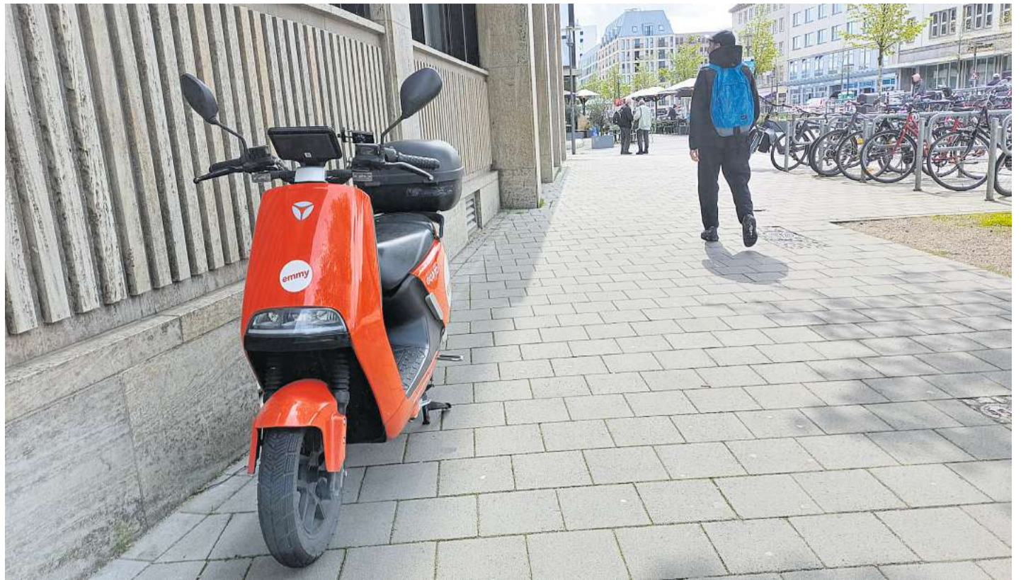
Ganz am Rand mit viel Platz für Fußgänger: So werden abgestellte Mopeds wie die von „emmy“ in Kiel geduldet.

In anderen Bundesländern hatten die Landesregierungen bereits vor Jahren beschlossen, die Bezeichnung Fachhochschule zu streichen. „Viele Studieninteressierte außerhalb von Schleswig-Holstein kennen die Bezeichnung Fachhochschule für unseren Hochschultyp gar nicht“, so Christensen weiter. Aktuell gebe es bundesweit nur noch acht vergleichbare staatliche Hochschulen mit dieser Bezeichnung. Der Entscheidung für die Umbenennung war ein intensiver Meinungsbildungsprozess vorangegangen. Unter anderem hatten rund 2800 Studierende die Möglichkeit genutzt, sich im Rahmen einer Abstimmung für einen der beiden vom Präsidium vorgeschlagenen Namen zu entscheiden, wie das studentische Senats-Mitglied Britta Ingwersen erklärt: „63 Prozent haben dabei für den Namen HAW Kiel votiert.“