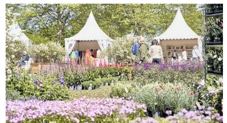
Das Motto der diesjährigen „Ambienta“ lautet: herrlich genießen, prachtvoll feiern.

Gutshof mitmachen. Es gibt Ponyreiten und eine Kinderbetreuung. Ein weiteres Highlight ist der Schlosspark, der für weitere Stände geöffnet wird und die Gelegenheit bietet, das Gut bei Live-Musik, Café, Drinks und Snacks noch einmal aus einer neuen Perspektive zu sehen. Über 100 000 Artikel von internationalen Ausstellern werden zu sehen sein - von Pflanzen bis zu Schmuck und einzigartigem Kunsthandwerk. Die Gastronomie bietet verschiedene Köstlichkeiten an, vom Cappuccino bis zum erfrischenden Aperol, von der vegetarischen Gemüsepfanne bis zum hausgemachten Wildburger. Parkplätze sind vorhanden. Die „Ambienta“ ist