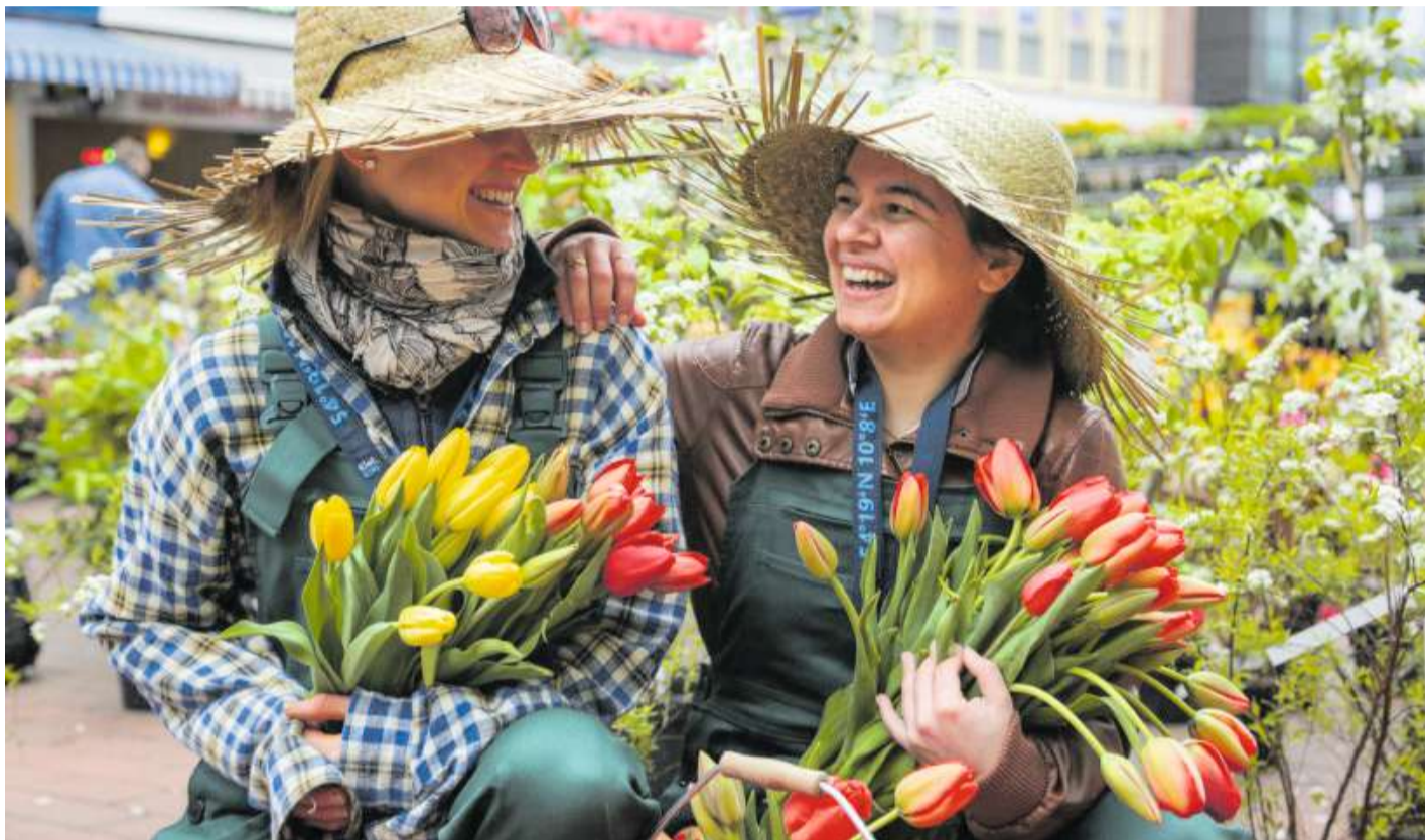
Zum Frühlingsfest „Kiel blüht auf“ am 27. und 28. April sind viele Aktionen in Kiel geplant.