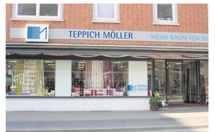
Teppich Möller in der Holtener Straße ist eine Institution in Kiel. Jetzt gibt das Geschäft auf.

Teppich Möller Holtener Straße 9, Kiel Tel. 0431/554420 info@teppich-moeller.de www.teppich-moeller.de