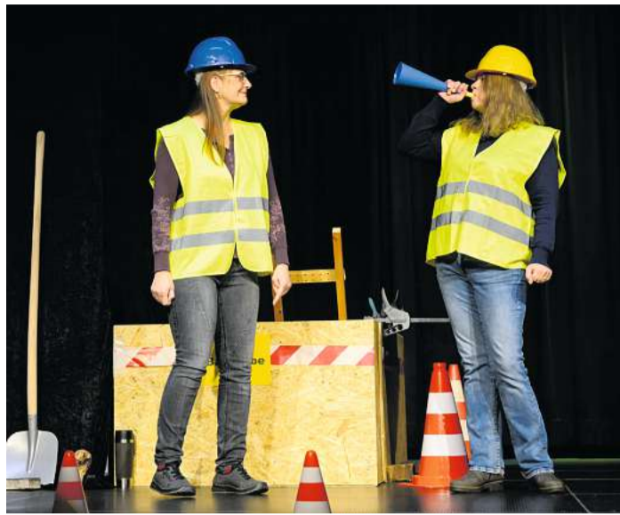
Mit Baustellen befasst sich das „Jedermanns-Kabarett“ heute Abend in Preetz.

Mit seinem Programm „Achtung Baustelle oder irgendwas ist immer“ ist das Kronshagener „Jedermanns-Kabarett“ am heutigen Sonnabend, 27. April , ab 20 Uhr in der Aula des Friedrich-Schiller-Gymnasiums, Ihlsohl 10-12, in Preetz zu Gast. Karten gibt es für 10 Euro bei der Volkshochschule Preetz im Hufenweg 5 und in der Buchhandlung am Markt in Preetz.