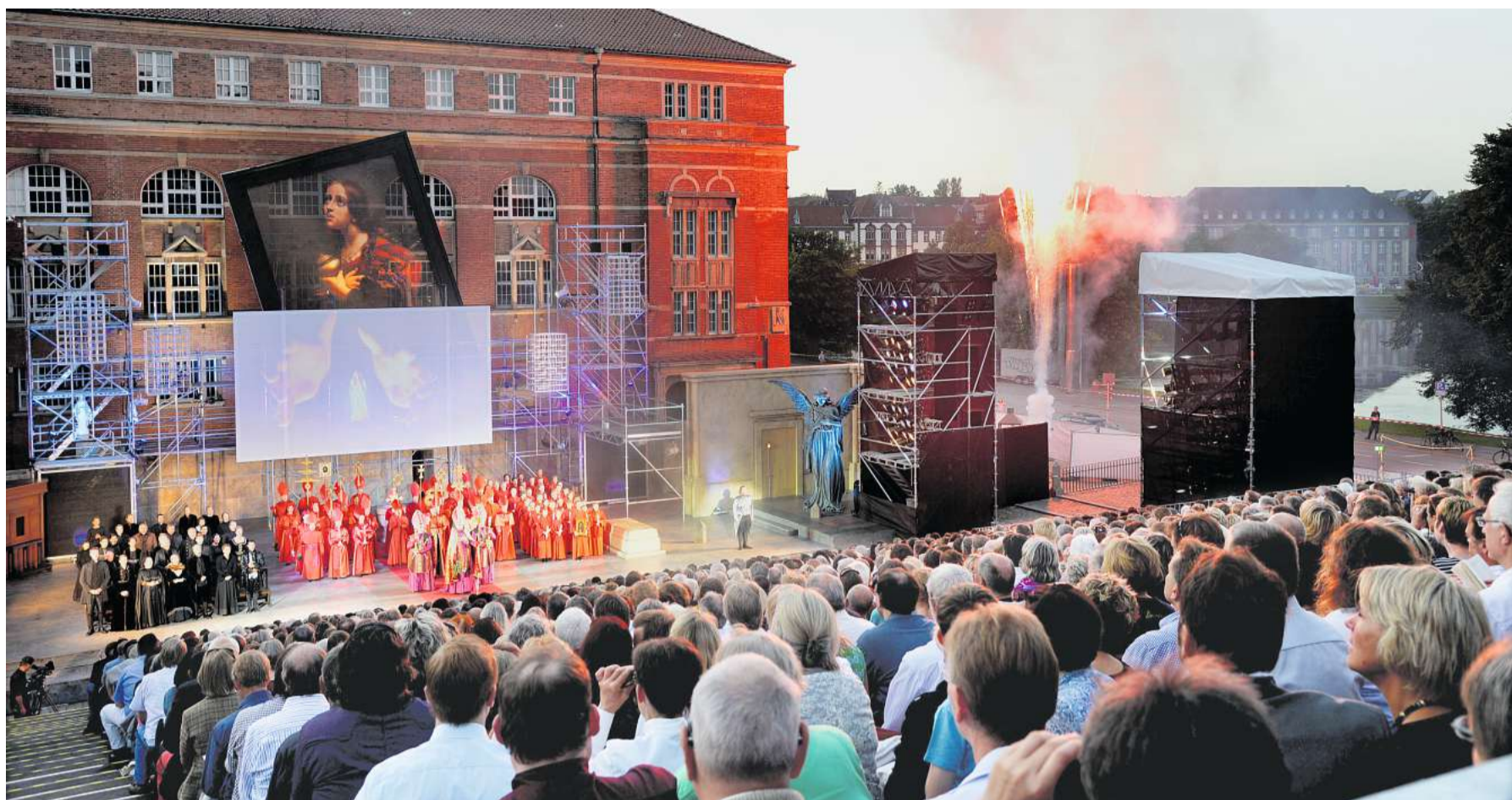
Puccinis „Tosca“ war die erste Sommeroper, die auf dem Rathausplatz gezeigt wurde. Im kommenden Jahr wird „La Traviata“ von Giuseppe Verdi ab Mitte Juli zu sehen und hören sein.

Das Ballett Kiel startet am 12. Oktober mit dem „Som-