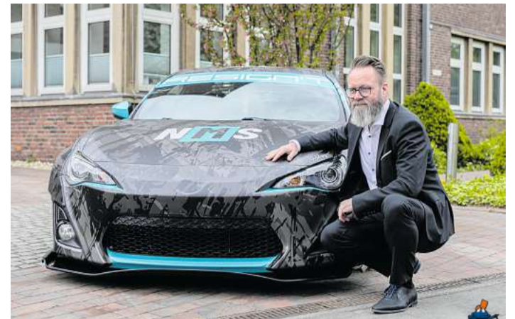
Die Stars im Eröffnungsfilm der „Nordic Motor Show“: Verkehrsminister Claus Ruhe Madsen und ein getunttes Auto.

Das Eiderheim in Flintbek , An der Bahn 100, lädt für den kommenden Sonnabend, 4. Mai , von 10 bis 16 Uhr wieder zum Frühlingmarkt mit Musik und Kinderprogramm ein.